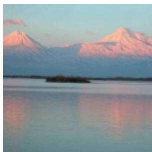
Armenia, tra Asia e Europa, seconda parte