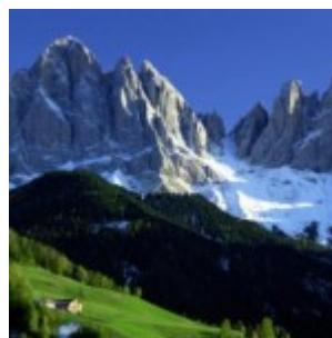
Trascorrere il Natale in una splendida vacanza sulla neve