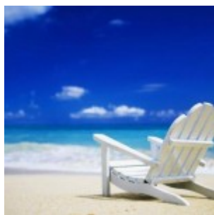
Vacanze invernali: ecco alcuni suggerimenti