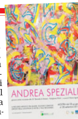
Il libro di Speziali che viene presentato oggi a Riccione