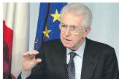
Monti il candidato ideale per l'Europa

BRUXELLES - «Dal punto di vista dell'Unione europea possiamo guardare con maggiore serenità all'anno 2013». Lo ha affermato il presidente del Consiglio Mario Monti al termine del vertice di Bruxelles. Al Consiglio europeo sono stati «ottenuti risultati che non erano affatto scontati e che qualcuno aveva definito non realistici», ha dichiarato. Poi, rispondendo a chi gli chiedeva un parere sugli endorsement ricevuti in Europa e su un suo eventuale ruolo futuro, il premier ha spiegato che «non è opportuno né possibile», a suo parere, «entrare nel me-