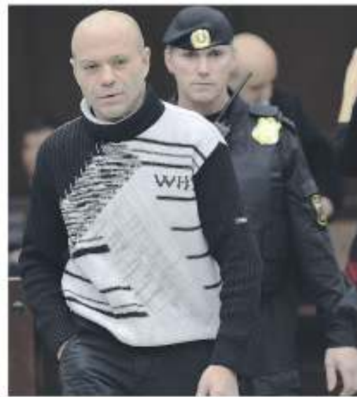
L'ex poliziotto in tribunale a Mosca

chenkov faceva parte della gang formata dal boss criminale Lom-Ali Gaitukayev, arrestato nel 2007 e condannato per il tentato omicidio di un imprenditore e accusato formalmente lo scorso anno nel quadro delle indagini sull'omicidio della Politkovskaya. «Per arrivare al recupero ed evitare nuovi atti criminali da parte del condannato è necessario l'isolamento dalla società», ha dichiarato il giudice, che ha descritto il quadro dell'omicidio di Politkovskaya. Pavlyuchenkov, reo-confesso, agì nell'ambito di un gruppo d'azione assoldato per l'omicidio della scomoda reporter. Trovati i manovali dell'assassino, però, sul caso Politkovskaya continua a pesare l'assenza dei mandanti e il totale silenzio delle autorità su questo aspetto.