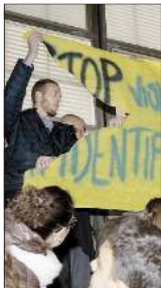
La contestazione del Paz

RIMINI - (TT) Sono stati denunciati alla magistratura, con le accuse di resistenza e manifestazione non autorizzata, i 9 attivisti del Paz, di cui 3 ancora in corso di identificazione, che lo scorso 17 novembre avevano fatto irruzione nel palazzetto dello sport di Rimini per contestare il ministro degli Interni Annamaria Cancellieri. In quella occasione, col il ministro impegnato a parlare davanti a una platea di 1500 studenti riuniti per la "Giornata della Legalità" organizzata dalla Prefettura e dagli enti locali, il manipolo di contestatori aveva