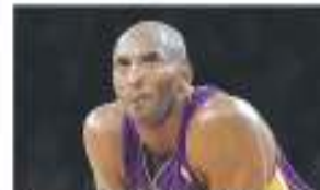
Bryant, stella dei Lakers

NEW YORK - LeBron James, nella Eastern Conference, e Kobe Bryant a Ovest, sono in testa alla votazione per il 62° All Star Game della Nba che si giocherà il 17 febbraio a Houston. James, Mvp della finale ed attuale campione con i Miami Heat, ha ottenuto al momento 641.348 voti, mentre Bryant è secondo con 639.419. Sarà possibile votare fino al 14 gennaio.