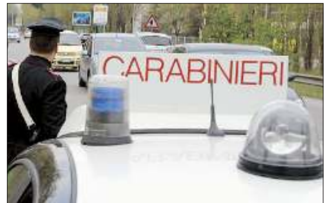
Nuovi arresti nell'inchiesta "Vulcano"