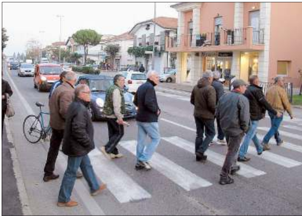
La protesta di ieri: in decine ad attraversare via Emilia

S.ARCANGELO - Santa Giustina sempre più sul piede di guerra. E' di ieri pomeriggio l'ennesima dimostrazione di dissenso verso traffico insostenibile e smog. Malgrado l'arrivo tempestivo di una pattuglia della polizia e di tre vigili, il traffico dalle 17 alle 19,30 è stato da record. I residenti si sono divisi in tre gruppi: all'inizio, alla fine e al centro della frazione, e hanno cominciato ad attraversare la strada. Avanti e indietro, rigorosamente sulle strisce pedonali. File di automezzi che iniziavano a San Martino in Riparotta e finivano alla rotonda della strada di gronda, accentuando ciò che accade ogni giorno, da qualche anno. Poco più di un centinaio di persone ad attraversare, meno dell'ultima volta perché si trattava di un giorno feriale, tuttavia producendo molto