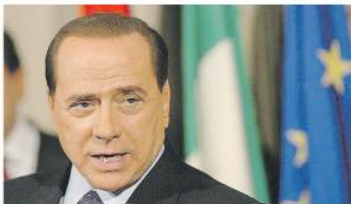
L'ex premier Berlusconi pronto al passo indietro

«Per questi motivi - è opinione dell'ex premier - finora è fallita quella grande aggregazione di tutte le forze moderate che è sempre esistita