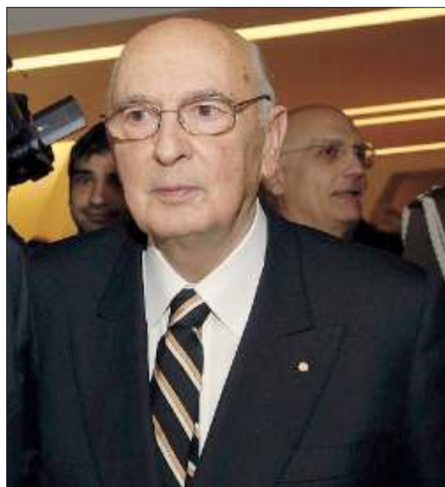
Il presidente Giorgio Napolitano

Draghi evocava. Continueremo a perseguirlo a casa nostra e nel concerto europeo”. “Non preoccupatevi”, la so-