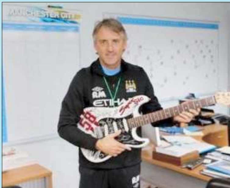
Roberto Mancini con la chitarra SuperSic