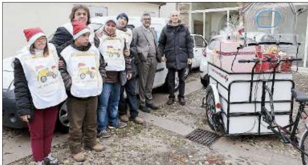
I protagonisti dell'iniziativa "Per una città amica"