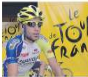
Il 28enne siciliano

ASTANA - È stata svelata al velodromo nazionale di Astana, la capitale del Kazakistan, la formazione in vista della stagione ciclistica 2013, alla presenza delle massime autorità del paese e del team manager Alexandr Vinokourov. Il campione olimpico di Londra, smessa la carriera da ciclista, vuole iniziare il nuovo cor-