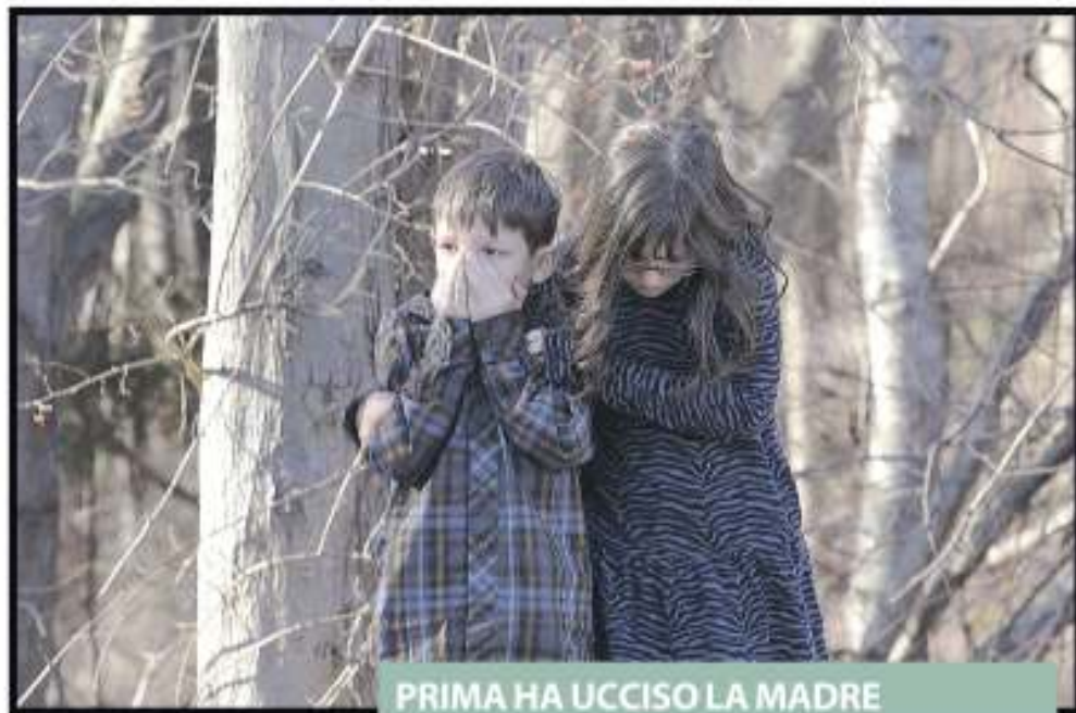
Due bimbi scampati alla strage

Il killer L'assaltatore, Ryan Lanza, un giovane di circa 20 anni originario del New Jersey, che in base alle prime ricostruzioni aveva dei legami con la scuola, è rimasto ucciso all'interno dell'edificio. Lanza aveva con sé quattro armi, tra cui due fucili, e indossava un giubbotto antiproiettile, secondo quanto riferito da Wabc. Al momento circola anche la notizia, non confermata, di un secondo cecchino. Una persona è in custodia della polizia, dopo essere stata fermata nel bosco vicino alla scuola con dei pantaloni mimetici, riferisce la Cbs. «Ora il luogo è in sicurezza», ha dichiarato un portavoce della polizia di Newtown. Si tratta di una delle stragi più sanguinose della storia americana, destinata a far rivive-