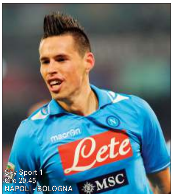
Sky Sport 1 Ore 20.45 NAPOLI - BOLOGNA