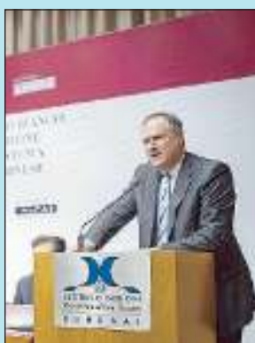
Un momento della presentazione

SAN MARINO - Presentato ieri al Kursaal “Titano 2018”, il libro bianco sul futuro del sistema finanziario. Il lavoro di ricerca promosso da Abs racconta di un piano di rilancio che comprende pilastri strategici per la piazza finanziaria, tutti già condivisi con gli esperti del Fondo monetario internazionale, della Banca mondiale e della Brookings Institution.