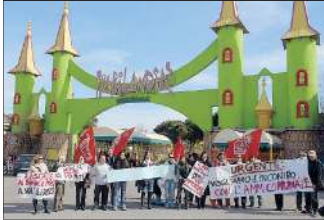
Una protesta dei lavoratori di Fiabilandia (FOTO D'ARCHIVIO)

L'azienda ha confermato la sua intenzione di procedere al licenziamento (scatterà da gennaio) di tutti gli 11 dipendenti annuali, 6 operai e 5 impiegati (verranno comunque riassunti ad aprile, alla riapertura del parco, con un contratto questa volta stagionale e non più a tempo indeterminato) e nello stesso tempo anche il suo piano di forti tagli per quanto riguarda i lavoratori stagionali, vale a dire gli addetti ai giochi e agli spettacoli, anche se non ha fornito in questo caso cifre precise: "E' proprio que-