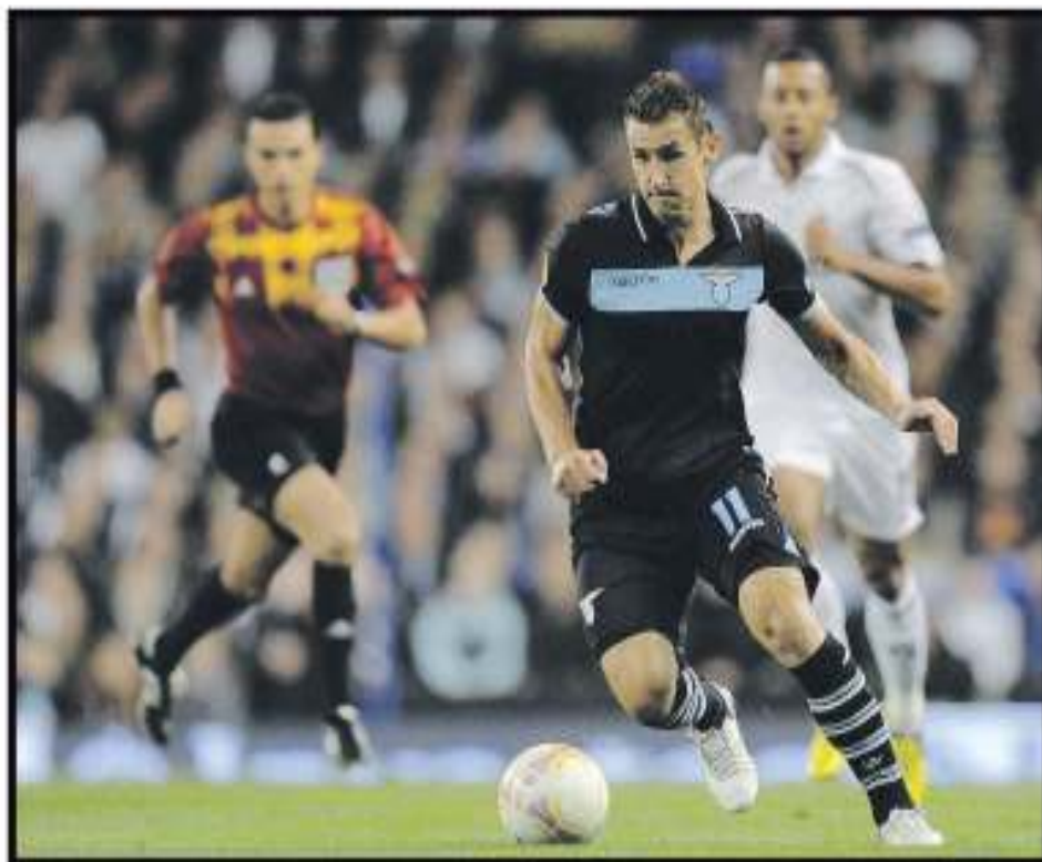
Klose, attaccante tedesco della Lazio