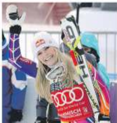
La 28enne Lindsey Vonn

trice afferma di essersi subito sentita «un'altra persona». «Ho avuto la fortuna di trovare il trattamento giusto», sottolinea la quattro volte campionessa della Coppa del mondo che conclude: «Finalmente tutte le componenti della mia vita sono ora sincronizzate. Accetto chi sono e guardo avanti». La svizzera Lara Gut ha vinto la discesa libera femminile di Coppa del Mondo della Val d'Isère con il tempo di 1:19.75 davanti alla statunitense Leanne