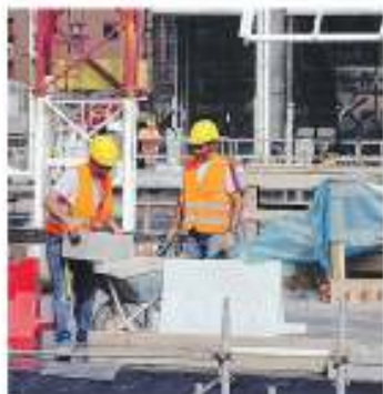
Costruzioni in ginocchio

Tra secondo e terzo trimestre dell'anno persi 400mila posti di lavoro